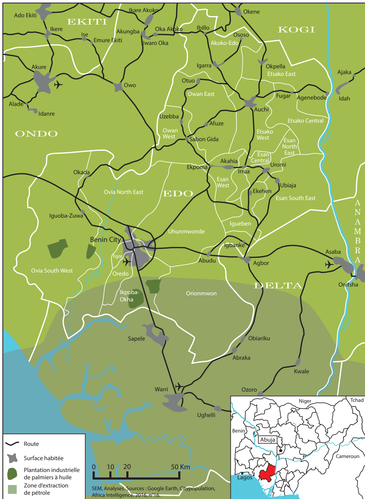
Carte 1: L'Etat d'Edo et ses Local Government Areas (LGA).