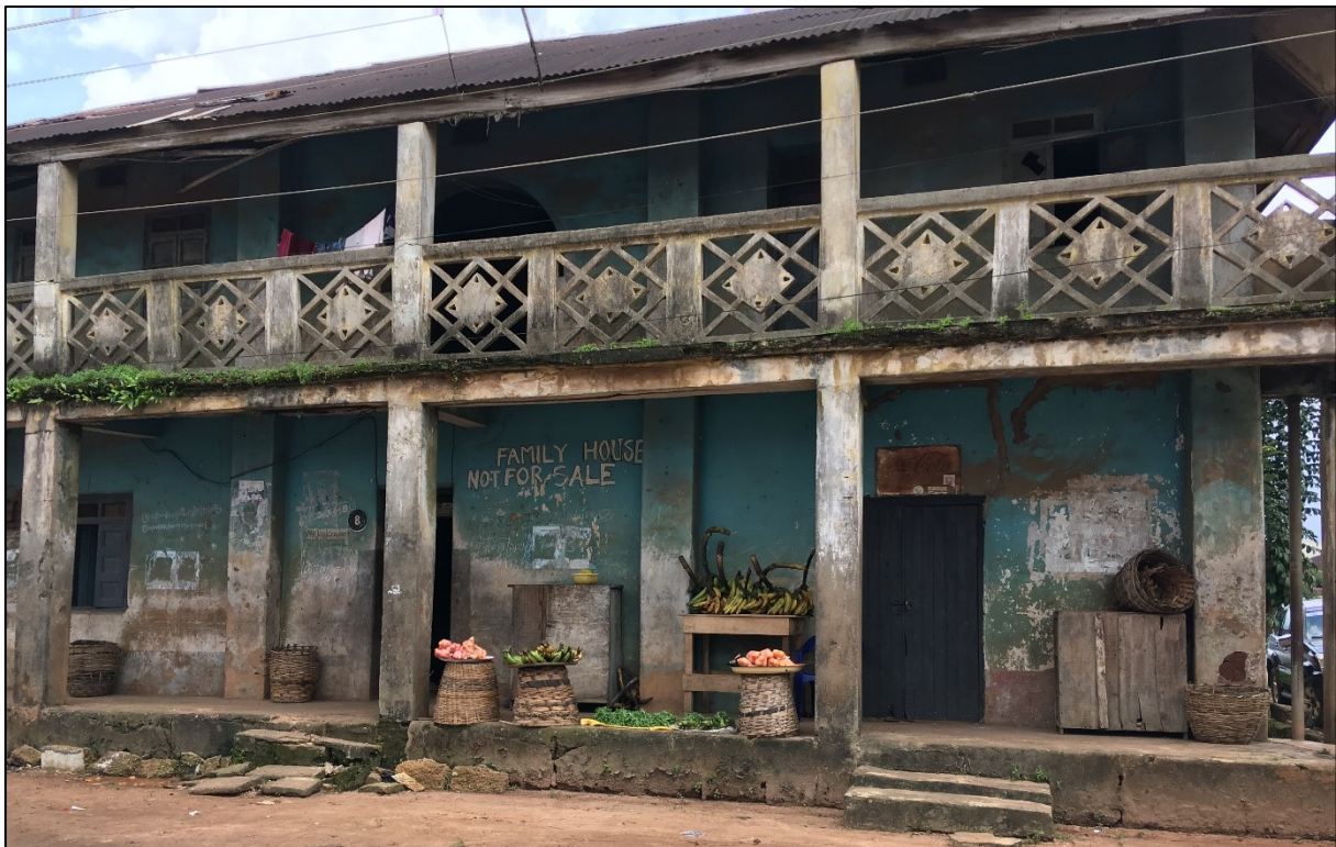
Benin City, septembre 2018.