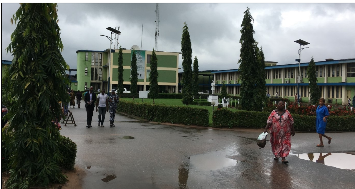
UBTH, entrée principale, septembre 2018.

le cancer de la prostate, mais pas disponible au Nigeria. Selon lui, cet établissement est confronté à des limites communes aux autres hôpitaux du pays, de par un manque d'équipement, de personnel et de financement des soins. Ceci implique de longues listes d'attente, mais le délai pour un traitement dépend aussi du degré d'urgence. 99