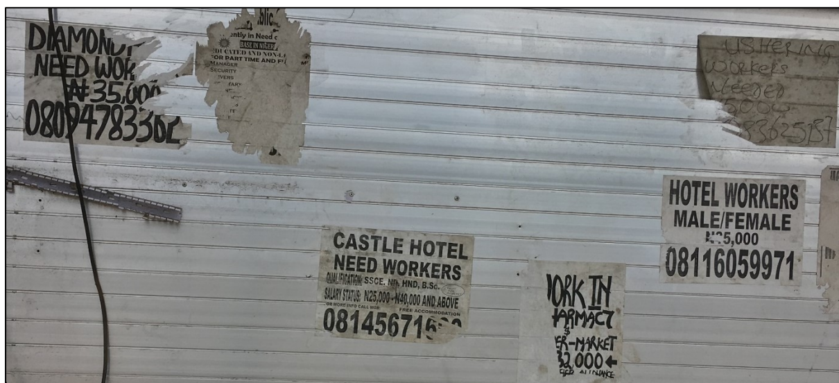
Panneau d'affichage de rue, Benin City, septembre 2018.

L'agence gouvernementale Edojobs a enregistré 200 000 personnes en recherche d'emploi dans l'Etat en 2017, et constaté que beaucoup manquaient de savoir-faire pour occuper les places de travail vacantes. 22 Contrairement aux groupes linguistiques Igbo et Yoruba, la population Edo n'a pas institué de système d'apprentissage particulier. 23 Bien que près de 700 skills acquisition centers (SAC) publics ou privés existent dans l'Etat, et que certains aient été ouverts en 2018, beaucoup manquent de moyens financiers et de personnel. 24 Certains SACs proposent des formations de six mois en cuisine, coiffure, couture ou secrétariat : des jeunes récemment sortis de l'école secondaire, des diplômés universitaires et des migrants rentrés comptent parmi leurs apprentis. 25