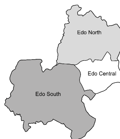
Carte 2 : districts sénatoriaux de l'Etat d'Edo

Edo — aussi dit Bini — désigne également le groupe linguistique majoritaire à Benin City, alors que la langue Esan — aussi dite Isan — est répandue dans le centre de l'Etat. Une vingtaine d'autres langues autochtones sont recensées : certaines reflètent des origines diverses, mais la majorité d'entre elles, y compris Esan, sont classifiées sous le groupe de langues de type Edo. 8 En parallèle, l'anglais conventionnel est enseigné à partir de la quatrième année de l'école primaire, tandis que le pidgin english joue le rôle de langue véhiculaire. 9 La zone linguistique Bini forme le district sénatorial Edo sud, la zone Esan le district Edo central, et le reste du territoire de l'Etat le district Edo nord (Carte 2). Chaque Etat nigérien comporte trois districts, car il produit autant de sénateurs fédéraux. 10