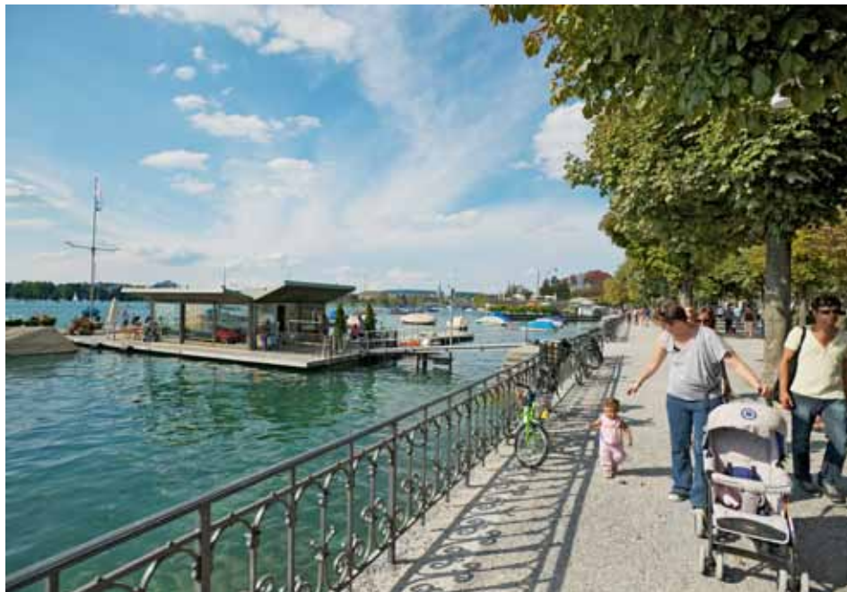
Neben wirtschaftlichen Motiven gehören Landschaft, Natur und Freizeitmöglichkeiten zu den entscheidenden Migrationsgründen. Auch Interesse an Neuem, Schweizer Kultur und Kontakte in der Schweiz sind wichtig.

Für Neuzuzüger aus dem EU-25/Efta-Raum stellen die beruflichen Perspektiven und die Möglichkeit, die Einkommenssituation zu verbessern, die wichtigsten Motive für den Umzug in die Schweiz dar. Häufig sind aber auch nicht-wirtschaftliche Gründe für einen Umzug ausschlaggebend, wie beispielsweise die Natur und Kultur oder Verwandte in der Schweiz. Schweizer Arbeitgeber nennen den Fachkräftemangel als Hauptgrund für die Rekrutierung von Personen. Eine geringere Rolle spielt das Lohn-Leistungs-Verhältnis.